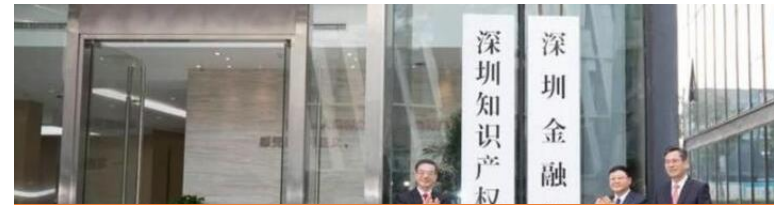
深圳知識產權法庭