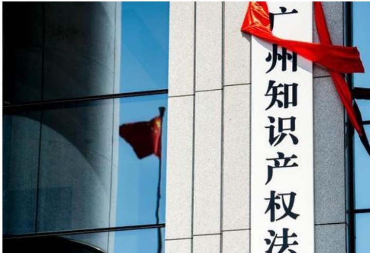
廣州知識產權法院