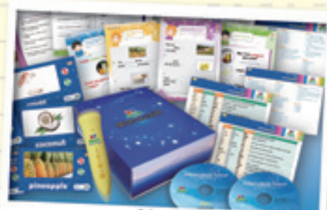
DR-Max 电子英语学习教材

晚上下班时宝妈凑巧在巴士上看到了“DR-Max”的英语教育宣传片，了解了它的核心教材“Electronic English”套装。这套系列教材依照可持续性之理念，编排每日功课量及奖励计划，鼓励学生持续学习。分为8个学习阶段的“Electronic English”英语学习套装寓教于乐，让孩子尽收学习的精髓，书中的“神奇魔法笔”，只要在纸上轻轻一点便可读出纸面上的内容；“趣味学习纸”让家长与孩子一起学习；“Flash Card”图片用来配合教授单词，是孩子的语言发展过程中非常重要的辅助角色；“高频词汇表”供孩子查阅工作纸的生词，辅助学习；如果把“Phonics Cards”串字配合“神奇魔法笔”，更是其乐无穷。