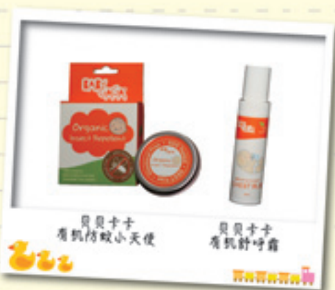
贝贝卡卡 有机防蚊小天使

“贝贝卡卡”有机婴童护肤系列实在是家庭必备的呵护用品。假期期间宝宝玩得开心、睡得舒服，宝妈也轻松安心、自在惬意地好好享受了一个无忧无虑的假期！